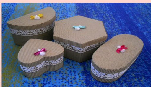
Ruční výroba z přírodní vlnité lepenky